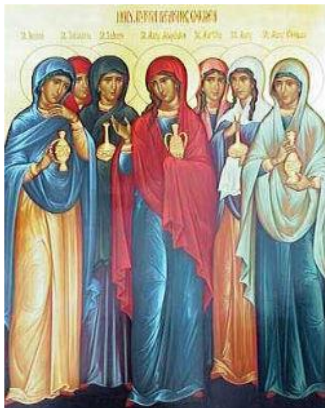
Икона «Святые жены мироносицы»