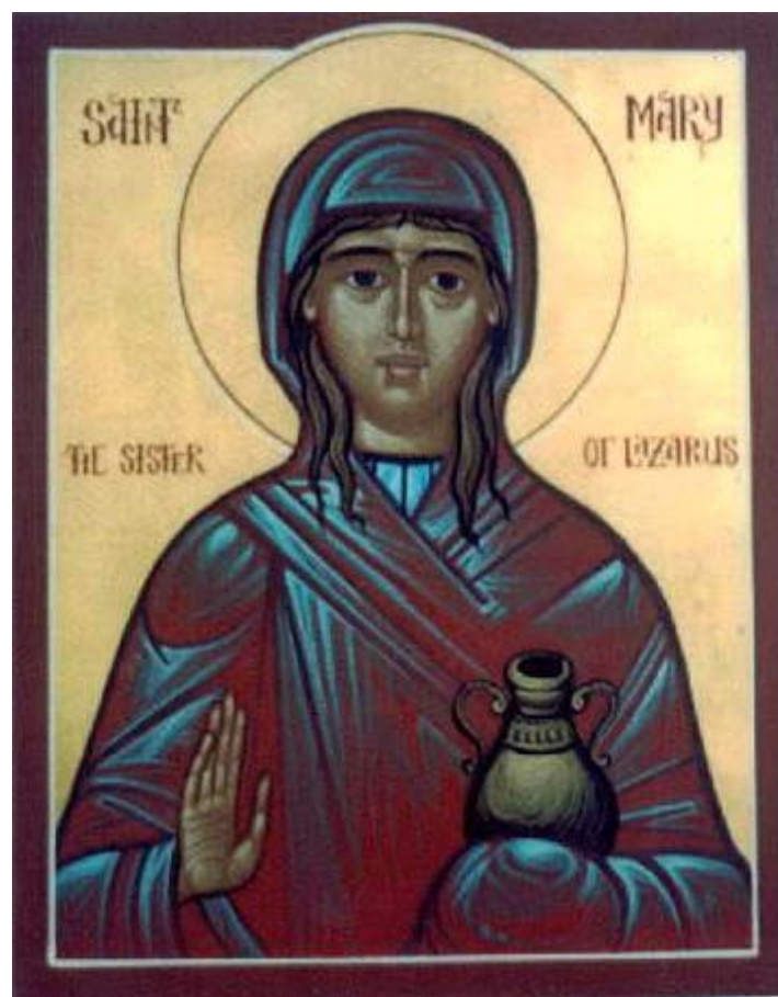
Икона «Праведная Мария »