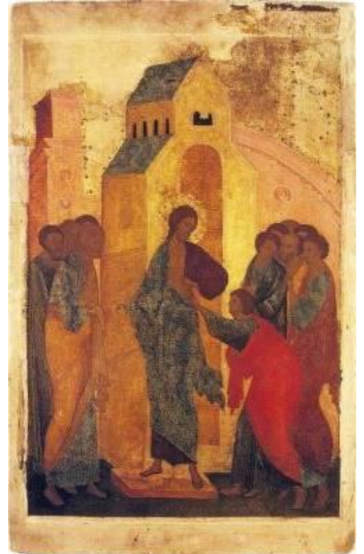
Икона «Уверение Фомы» 1500 г

Людские мудрецы великие В атомный ад ведут народы, А белые платочки тихие Собой скрепляют церкви своды.