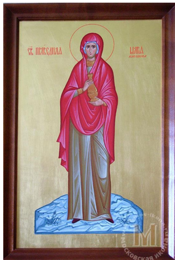
Икона «Св. Мария Клеопова»

Святая Мария Клеопова, мироносица, по преданию Церкви была дочерью праведного Иосифа, Обручника Пресвятой Девы Марии (память 26 декабря), от первого брака и была еще совсем юной, когда Пресвятая Дева Мария была обручена праведному Иосифу и введена в его дом. Святая Дева Мария жила вместе с дочерью праведного Иосифа, и они подружились, как сестры. Праведный Иосиф по возвращении со Спасителем и Божией Матерью из Египта в Назарет выдал замуж дочь за своего меньшего брата Клеопу, поэтому она именуется Марию Клеоповою, т. е. женой Клеопы. Благословенным плодом того брака был священномученик Симеон, апостол от 70-ти, сродник Господень, второй епископ Иерусалимской Церкви (память 27 апреля). Память святой Марии Клеоповой празднуется также в Неделю 3-ю по Пасхе, святых жен-мироносиц.