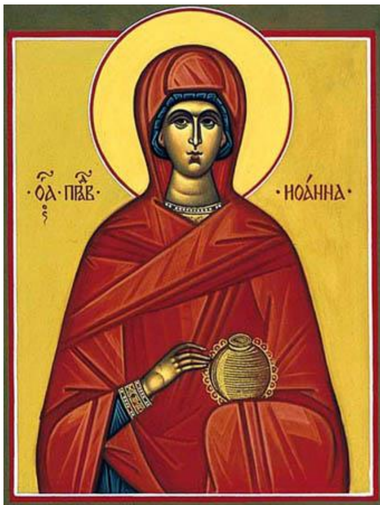
Икона «Иоанна Мироносица»

Святая Иоанна Мироносица, супруга Хузы, домоправителя царя Ирода, была одной из жен, следовавших за Господом Иисусом Христом во время Его проповеди, и служила Ему. Вместе с другими женами после Крестной смерти Спасителя святая Иоанна приходила ко Гробу, чтобы помазать миром Святое Тело Господа, и слышала от Ангелов радостную весть о Его славном Воскресении.