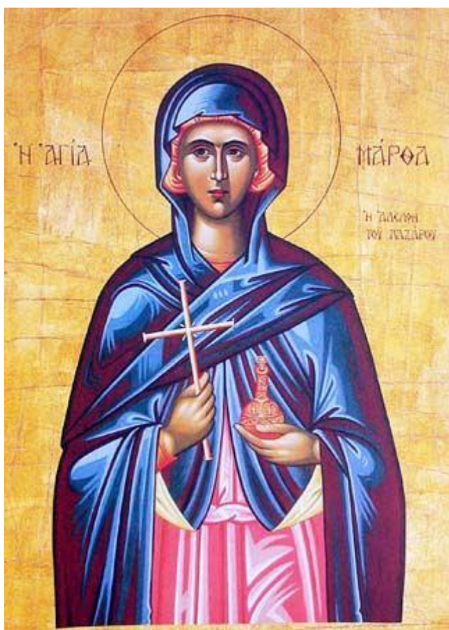
Икона «Праведная Марфа»

Праведные сестры Марфа и Мария, уверовавшие во Христа еще до воскрешения Им их брата Лазаря, по убиении святого архидиакона Стефана, наступлении гонения на Церковь Иерусалимскую и изгнании праведного Лазаря из Иерусалима, помогали своему святому брату в благовествовании Евангелия в разных странах. О времени и месте их мирной кончины сведений не сохранилось.