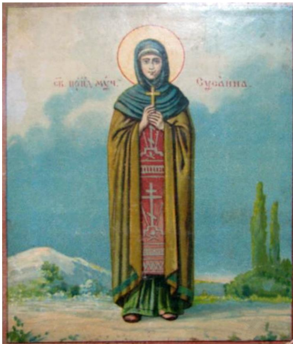
Икона «Святая праведная Сусанна»

Святая праведная Сусанна, одна из благочестивых женщин, сопутствующих Христу и служивших Ему от своих имений. О ней упоминается в Евангелии.