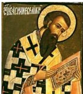
Святитель Василий Великий

Василий спешно возвратился в Кесарию по вызову епископа Евсевия. По словам Григория Богослова, для епископа Евсевия он был "добрым советником, праведным предстателем, истолкователем Божия Слова, жезлом старости, опорой верным в делах внутренних, самым деятельным в делах внешних". С того времени и церковное правление перешло к Василию, хотя по иерархии занимал он второе место. Проповеди говорил он ежедневно, и часто дважды - утром и вечером. В это время святой Василий составил чин Литургии ; им написаны также Беседы на Шестоднев, на 16 глав пророка Исаии , на псалмы, второе собрание монашеских правил. Против учителя ариан Евномия, который с помощью аристотелевых построений придал арианской догматике научно-философскую форму, превращая христианское учение в логическую схему отвлеченных понятий, Василий написал три книги.