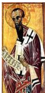
Василий Кесарийский и Каппадокийский

Общее печальное положение усугублялось для епископа Кесарийского еще и такими обстоятельствами, как разделение Каппадокии на две части при распределении правительством провинциальных округов; антиохийский раскол, вызванный поспешным поставлением второго епископа; отрицательное и высокомерное отношение западных епископов к попыткам привлечь их к борьбе с арианством и переход на сторону ариан Евстафия Севастийского, с которым Василия связывала тесная дружба. Среди постоянных опасностей святой Василий поддерживал православных, утверждал их веру, призывая к мужеству и терпению. Святым епископом написаны многочисленные письма к Церквям, епископам, клиру, частным лицам. Низлагая еретиков "оружием уст и стрелами письмен", святой Василий, как неутомимый защитник Православия, всю свою жизнь вызывал неприязнь и всевозможные происки ариан.