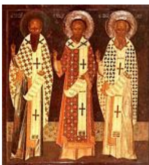
Собор Вселенских святителей

Болезни от юности, труды учения, подвиги воздержания, заботы и скорби пастырского служения рано истощили силы святителя. Преставился святитель Василий 1 января 379 года в возрасте 49 лет. Незадолго перед кончиной святитель благословил святого Григория Богослова на принятие Константинопольской кафедры.