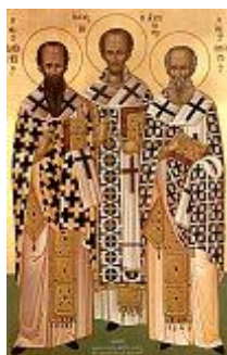
Василий Великий, Иоанн Златоуст и Григорий Богослов

чувствителен. Смерть же для меня благодетель: она скорее приведет меня к Богу, для Которого живу и тружусь, к Которому давно я стремлюсь". Правитель был изумлен таким ответом. "Может быть, - продолжал святитель, - ты не встречался с епископом; иначе, без сомнения, услышал бы такие же слова. Во всем ином мы кротки, смиреннее всякого, и не только пред таким могуществом, но и пред всяким, потому что так предписано нам законом. Но когда дело идет о Боге и против Него дерзают восставать, тогда мы, всё прочее вменяя за ничто, взираем только на Него Единого, тогда огонь, меч, звери и железо, терзающее тело, скорее будут для нас удовольствием, нежели устрашат".