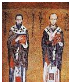
Василий Великий и Иоанн Златоуст

Святитель Василий Великий, архиепископ Кесарии Каппадокийской, "принадлежит не одной Кесарийской Церкви, и не в свое только время, не одним соплеменникам своим был полезен, но по всем странам и градам вселенной, и всем людям приносил и приносит пользу, и для христиан всегда был и будет учителем спасительнейшим", - так говорил современник святителя Василия, святой Амфилохий, епископ Иконийский (+ 344; память 23 ноября).