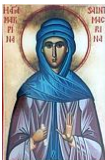
Макрина - сестра Василия Великого

Около 357 года святой Василий возвратился в Кесарию, где некоторое время преподавал риторику. Но вскоре, отказавшись от предложения кесарийцев, желавших поручить ему обучение юношества, святой Василий вступил на путь аскетической жизни.